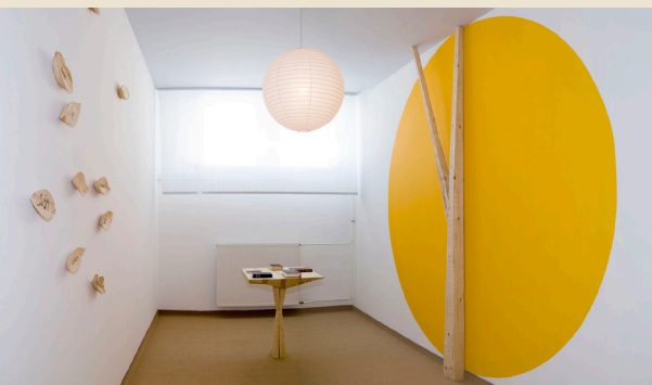
Soba za tišino (prostor za molitev)

Bivanje v Centru, kjer jim je omejeno gibanje, povzroča stres in tesnobo. Zato je druženje z njimi pomembno in deluje anti-stresno. Izvajamo pa tudi pastoralno pomoč za katoličane v t.i. sobi za tišino, ki se nahaja v tem Centru.