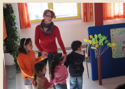
Prostovoljka z otroki

Kako vidiš prihodnost Evrope, kamor prihaja še posebej veliko število migrantov: Se bo kultura temeljno spremenila? Kaj to pomeni za krščanstvo v Evropi?