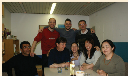
p. Robin s prostovoljci

V Sloveniji je naše poslanstvo tudi raznoliko. Delujemo v Azilnem domu (Ljubljana), ki je institucija odprtega tipa in tudi v Centru za tujce (Postojna), ki je institucija zaprtega tipa in ga varuje slovenska policija. Pri našem delu nam pomagajo tudi prostovoljci in prostovoljke.