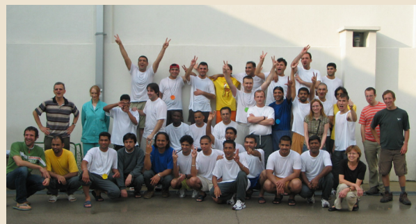
Igre brez meja

je lahko težko in dolgo. Ne razumejo, zakaj morajo tako dolgo čakati na njihovo odobritev. Zato jim Jezuitsko združenje za begunce želi biti blizu in jim stati ob strani. To jim veliko pomeni. V Centru za tujce je t. i. psihosocialna pomoč tujcem, ki čakajo na izgon v lastno deželo, še toliko bolj pomembna, saj je njihova svoboda omejena. Včasih težko sprejmejo, da se morajo vrniti v svojo deželo, saj se njihove življenjske sanje niso uresničile, da bi lahko ostali kje v Evropi. Nekateri ne vedo niti tega, kje so in zakaj so nastanjeni v takih prostorih. Zato jim skušamo vlivati upanje, da bodo kmalu odšli ven iz tega Centra. Topla in jasna beseda, polna empatije, pomaga ustvariti tudi mostove prijateljstva. Ko jih obiskujemo teden za tednom, se to še posebej vidi. Zelo so veseli, da kdo pride od 'zunaj' in se zanima za njihovo osebno situacijo. Tako se počutijo bolj(š)e, saj ne občutijo, da so pozabljeni.